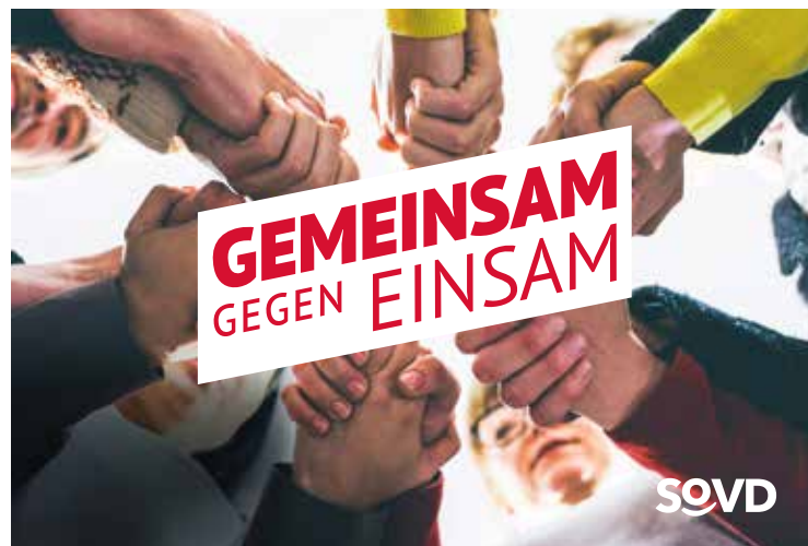
Gemeinschaft und Solidarität sind Stärken des SoVD. Diese vermittelt er auch in der Kampagne „Gemeinsam gegen einsam“.

Der SoVD bietet gelebte Gemeinschaft und Solidarität. Mit der Kampagne „Gemeinsam gegen einsam“ will der Verband das Thema in den Fokus rücken und Menschen die Hand reichen, ihnen Mut machen und helfen, wo immer Hilfe benötigt wird. Die Kampagne wird viele Aspekte von Einsamkeit aufgreifen und digital bespielen. Eine eigene Kampagnenseite ist unter www.sovd-gemeinsam.de eingerichtet. Dort gibt es Informationen zum Thema sowie über die Angebote des SoVD und die Forderungen des