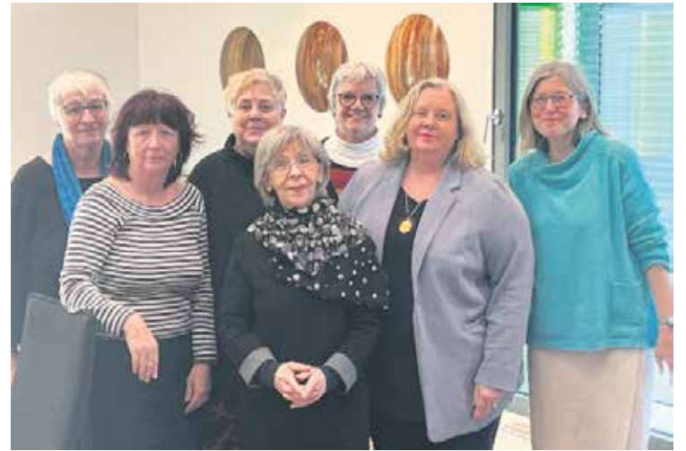
Beim Seminar „Soziale Medien“ des Frauenpolitischen Ausschusses.

Doch selbst bei vergleichbaren Tätigkeiten und Erwerbsbiografien waren es noch 7 Prozent Lohnabstand – ohne