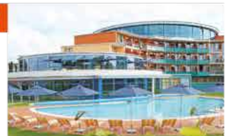
4+ Kurzentrum Waren (Müritz)

Freizeit/Kur/Unterhaltung: Die großzügige Bade- und Saunalandschaft verfügt über ein ganzjährig beheiztes Außenschwimmbekken/Thermalsoleaußenbecken (230 m 2 ), Schwimmbad (180 m 2 ), Whirlpool, Finnische Sauna, Bio-Sauna, Aroma-, Soledampfbad und Infrarotkabine. Auf ca. 2.000 m 2 bietet das Kurzentrum eine einzigartige Vielfalt an Verwöhn- und Therapieanwendungen sowie Fitness- und Gerätetraining. Für einen ganz besonderen Frischekick und neue Energie sorgt die Ganzkörperkältekammer mit minus 110°C.