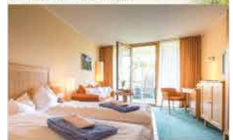
Zimmerbeispiel, 4+ Kurzentrum Waren (Müritz)