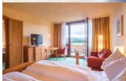
Zimmerbeispiel, 4+ Kurzentrum Weißensadt am See