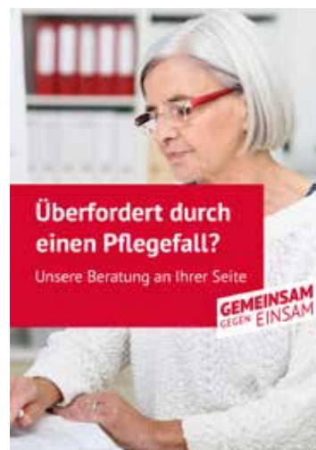
Ein Motiv auf Social Media.

„Gemeinsam gegen einsam“ läuft bis zur regulären Bundesverbandstagung des SoVD im November 2023 und wird dort auch das Motto sein. str