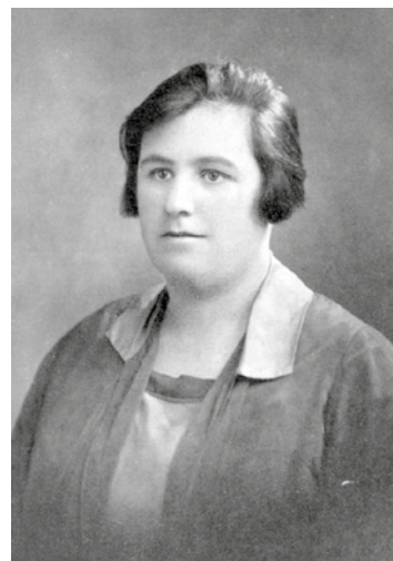
Helen Duncan (1897–1956): Medium oder Scharlatanin?

Bereits als Siebenjährige soll sie Kontakt zu Geistern gehabt haben. Ihre Mutter riet dem Mädchen damals, dies besser geheimzuhalten. Doch für die erwachsene Helen Duncan schien der direkte Draht zum Jenseits eine gute Einnahmequelle. Gutgläubige Spiritisten kamen immer wieder zu der Frau, die unter ihrem Spitznamen „Höllische Nell“ („Hellish Nell“) zu einer lokalen Berühmtheit wurde. Selbst Berichte, wonach ihr „Ektoplasma“ aus Eiweiß und Klopapier bestand, änderten nichts an Duncans Beliebtheit. Doch dann kam der Zweite Weltkrieg.