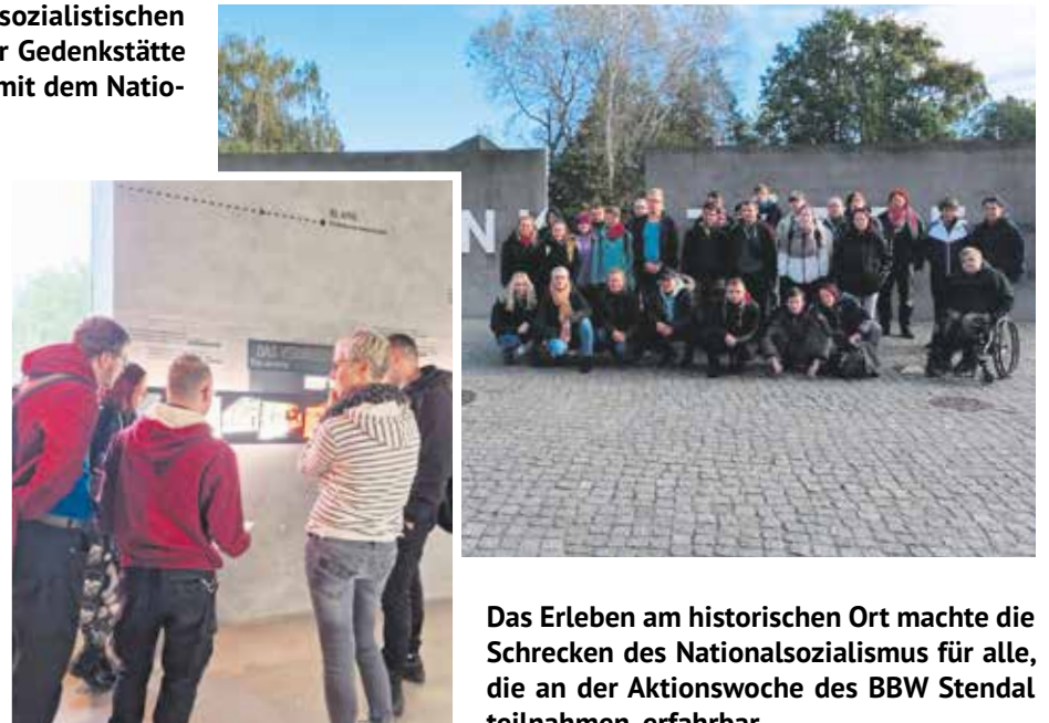
Das Erleben am historischen Ort machte die Schrecken des Nationalsozialismus für alle, die an der Aktionswoche des BBW Stendal teilnahmen, erfahrbar.

Die Collagen sind in der Mensa des BBW ausgestellt und vermitteln einen Eindruck von der Woche.