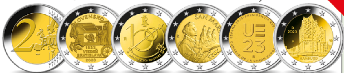
Gemeinsame Rückseite Ø je 25,75 mm | 2-Euro Slowakei „200 Jahre Pferdepost“ | 2-Euro Italien „100 Jahre Luftstreitkräfte“ | 2-Euro San Marino „Der heilige Marinus“ | 2-Euro Spanien „Vorsitz im Rat der EU“ | 2-Euro Deutschland „Elbphilharmonie“