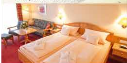
Zimmerbeispiel, 3★sup. Hotel Birkenhof Terme