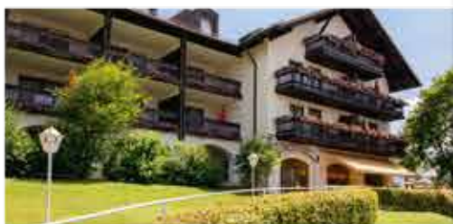
3★sup. Hotel Birkenhof Terme

Freizeit/Kur/Unterhaltung: Schöpfen Sie neue Kraft in der hauseigenen, 1.600 m 2 großen „Poseidon-Thermo“ u.a. mit Süßwasser-Freibad (15 x 8 m, ca. 28°C), Thermal-Innenbecken (13 x 8 m, ca. 36°), Dampfgrötte und Infrarotkabine. Im Beauty- und Physiotherapie-Bereich können Sie sich gegen Aufpreis verwöhnen lassen.