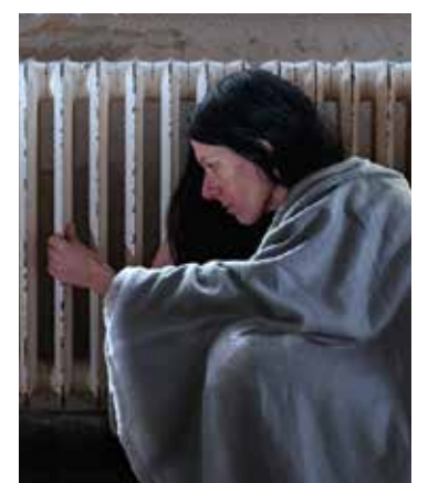
Das Motiv der SoVD-Kampagne.

Die Anmeldung ist offen und kostenfrei. Den Link zur Anmeldung finden Sie auf der Kampagnenseite unter www.sozialekaelte.de . Der erste Versand erfolgt bereits in Kürze.