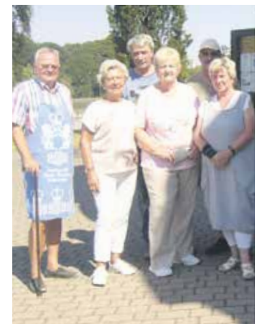
Der engagierte Kreisvorstand.