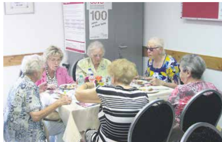
Nach den Corona-Beschränkungen tat Gemeinschaft besonders gut.

Unter dem Motto „Gemeinsam statt einsam“ wird die Arbeit des Kreisverbandes Wernigerode auch in Zukunft im Interesse der Mitglieder sein.